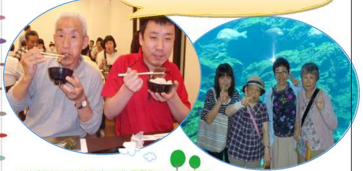
牛タンおいしいよ♪

お昼は伊達の牛タン本舗で、牛タンの定食を食べました。噛みごたえがあって、ごはんがすすんでおかわりをしました。