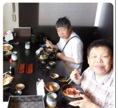
豪華な海鮮丼に大満足

【感想】エビが大きくて食べご たえがありました。他の具も大 きくカットされてボリュームが ありました。