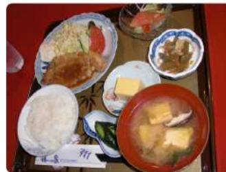
ふじのやランチ 950円