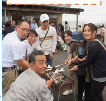
笹かまぼこ焼き体験

2日目は、仙台うみの杜水族館に行きました。カワウソと触れ合ったり、ペンギンにエサをあげるコーナーがあり、楽しみました。水族館でお土産をたくさん買ってきました。