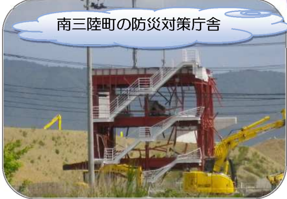
南三陸町の防災対策庁舎